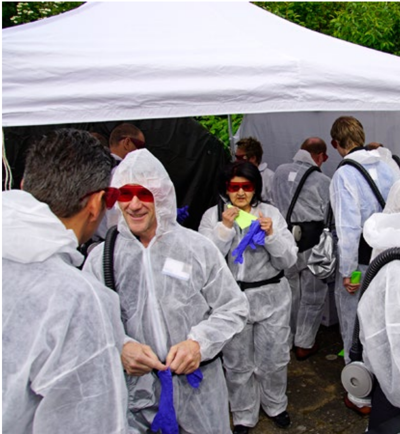
In teams gingen de deelnemers aan de slag met een echte zaak.

Bloedsporen terugvinden en details onthouden. Tijdens de Masterclass Opsporing moesten deelnemers een echte zaak oplossen. Een idee van het Q-team, drie politie-medewerkers uit Oost-Nederland die zijn vrijgemaakt om te werken aan innovatie en verbetering van de opsporing.